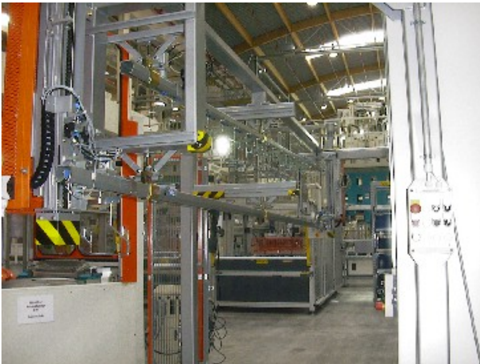
Projekt: Hängeförderanlage (S7-200 mit Asi)